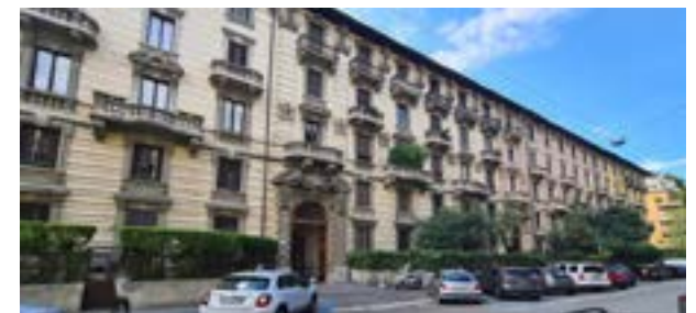
MILANO - via Ceradini (zona Plebisciti)

C. E. "G" - eph 324,50 Kwh/m 2 a Rif: 2874DZ