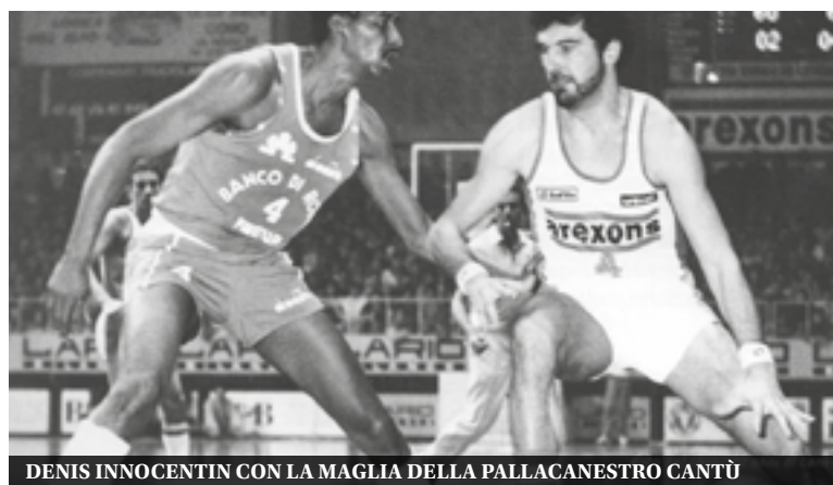
DENIS INNOCENTIN CON LA MAGLIA DELLA PALLACANESTRO CANTÙ

E fanno 28! Tante sono le edizioni del prestigioso torneo di basket Denis Innocentin , tra i più rinomati e storici in Lombardia a livello giovanile. Anche quest'anno molte delle più titolate squadre della palla a spicchi si contenderanno sui parquet cittadini l'ambito trofeo dedicato alla memoria del grande cestista italiano, scomparso troppo precocemente nel 1991, a soli 29 anni. Cresciuto nel CGB, in seguito ha difeso i colori di Pallacanestro Cantù e Aurora Desio. E non a caso è stata proprio la partita tra CGB e Cantù ad alzare il sipario sulla competizione, giovedì 25 aprile alle 9.30, nell'impianto di via Manin. L'altissimo livello tecnico del girone A, si conferma anche grazie alla presenza di Varese e