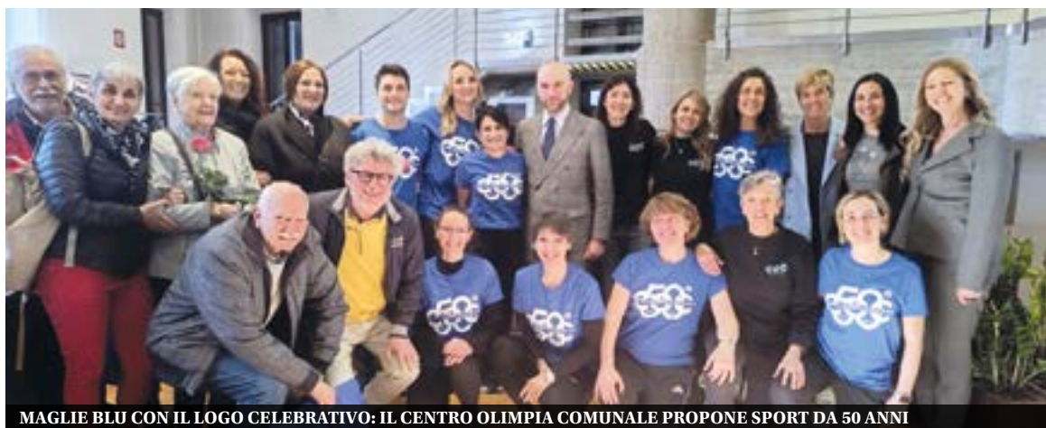
MAGLIE BLU CON IL LOGO CELEBRATIVO: IL CENTRO OLIMPIA COMUNALE PROPONE SPORT DA 50 ANNI