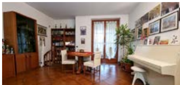
AGRATE BRIANZA - via Puccini

C. E. "E" - eph 149,27 Kwh/m 2 a Rif: 2881DZ