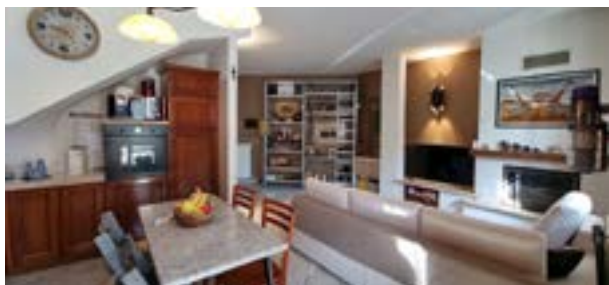
BRUGHERIO - viale Lombardia

In ottimo contesto condominiale del 2004 denominato "i Giardini di Moncucco" con bel giardino comune, 3 LOCALI su due livelli. CANTINA e BOX DOPPIO.