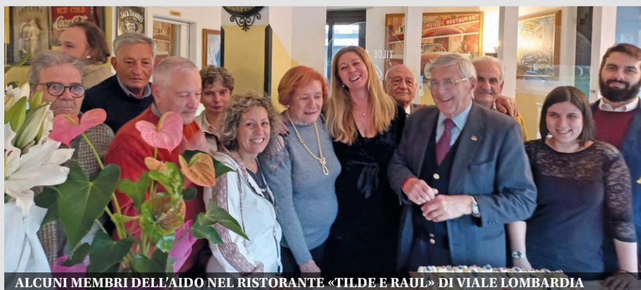
ALCUNI MEMBRI DELL'AIDO NEL RISTORANTE «TILDE E RAUL» DI VIALE LOMBARDIA