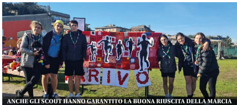
ANCHE GLI SCOUT HANNO GARANTITO LA BUONA RIUSCITA DELLA MARCIA