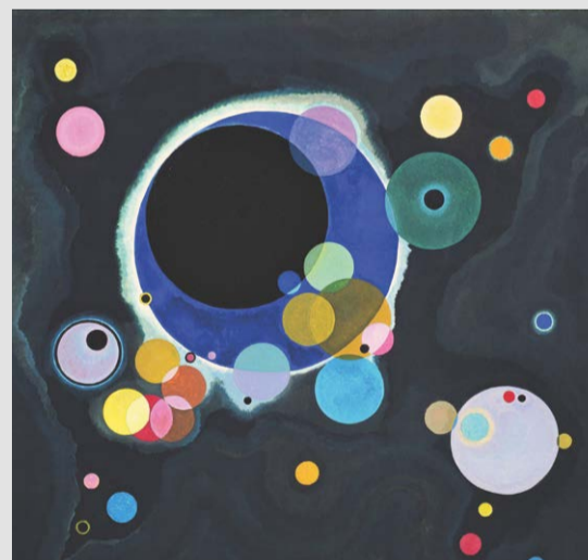
VASILIJ KANDINSKY, "ALCUNI CERCHI" ("EINIGE KREISE"), 1926 GUGGENHEIM MUSEUM, NEW YORK

Si terrà sabato 3 dicembre alle ore 15.30 nella sala conferenze della Biblioteca di via Italia 27, la conferenza dell'associazione Subrosa dal titolo "L'Odessa di Kandinsky". Relatori la dott.ssa Anna Torterolo , former Biblioteca Braidense di Brera, Milano, e Francesco Pelizzoni . Subrosa ha una cifra stilistica e comunicativa molto peculiare, quindi lasciamo al dott. Pelizzoni la suggestiva presentazione della conferenza: «L'idea nasce dall'Attuale, ma trova origine nel lungo viaggio al termine delle noti di Subrosa, viaggio altrimenti muto, come l'ambiente che ci circonda, come il tempo che attraversiamo. Vasilij Kandinsky ha vissuto parte della sua adolescenza a Odessa. Odessa: la sua storia 'italiana', orizzontale-verticale-diagonale architettonico 'italiano'. Wassily e lezione tenute presso la scuola del Bauhaus nel 1922. La scienza dell'arte e le sinestesi esplorate concettualmente. La Matematica e la Fisica che di per sé, e per prime, sono antinomie del concetto della Rappresentazione, e proprio in