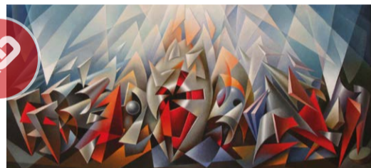
RISURREZIONE, PARTICOLARE, COURTESY FAMIGLIA BRUSCHETTI

È l'ultimo fine settimana disponibile per visitare la mostra evento su Alessandro Bruschetti, rappresentante del futurismo, dell'aeropittura e della purilumetria. Si può visitare sabato 3 dicembre dalle ore 15 alle 19 e domenica 4 dalle ore 10 alle 12.30 e dalle 14.30 alle 19. Domenica, alle ore 16 e alle 17.30, visite guidate gratuite.