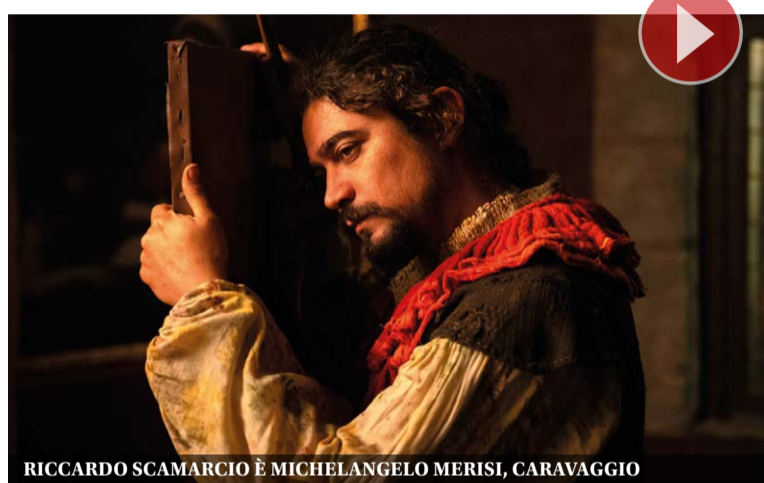
RICCARDO SCAMARCIO È MICHELANGELO MERISI, CARAVAGGIO

durante la sua vita "da avanzo di galera", fatta di grandi bevute e di rapporti sessuali con "donne di malaffare" e ragazzi, le risse sono state all'ordine del giorno. Del resto la sua "vita spericolata" è riflessa nei suoi dipinti, in cui una prostituta può diventare la Vergine Maria e un senzatetto San Pietro capovolto sulla croce. Per questo la Chiesa gli mette alle calcagna una sorta di inquisitore che ha il compito di indagare sul suo passato e di mettersi in contatto con le persone a lui più vicine, quelle che malgrado tutto lo