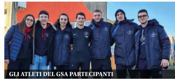
GLI ATLETI DEL GSA PARTECIPANTI