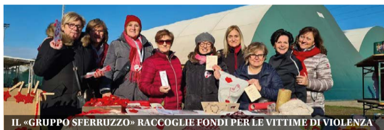
IL «GRUPPO SFERRUZZO» RACCOLLE FONDI PER LE VITTIME DI VIOLENZA

E proprio all'arrivo era presente il Gruppo Alpini, pronto a offrire una bevanda calda ai tanti partecipanti alla marcia nonostante la mattinata soleggiata, ma fredda.