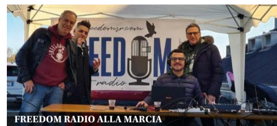
FREEDOM RADIO ALLA MARCIA