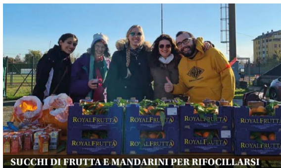
SUCCHI DI FRUTTA E MANDARINI PER RIFOCILLARSI