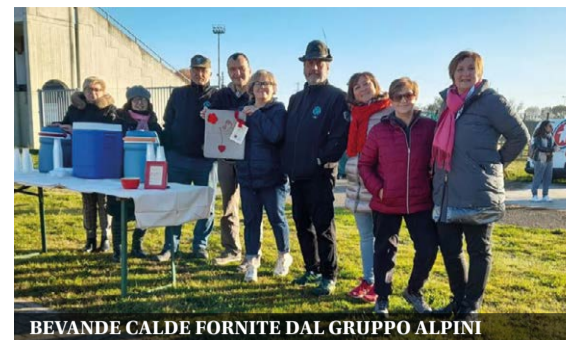
BEVANDE CALDE FORNITE DAL GRUPPO ALPINI

Decine di persone hanno partecipato alle manifestazioni organizzate contro la violenza sulle donne