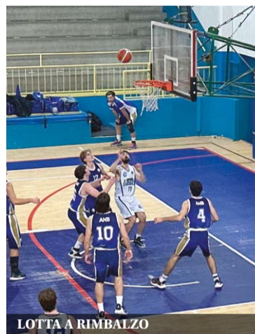
LOTTA A RIMBALZO

Azzurri Niguardese si è rivelato un avversario di valore, che ha prevalso anche grazie alla propria maggiore propensione al gioco fisico, costringendo gli arbitri a fischiare molti falli. Anche sugli spalti il clima è stato rovente fin dal via: i pochi tifosi ospiti hanno protestato ad ogni fischio dei direttori di gara, inveendo contro di loro a ogni interruzione e generando, alla lunga, il malumore dei sostenitori di casa. Tornando a quanto accaduto in campo, Azzurri Niguardese sotto canestro hanno avuto un rendimento pressoché lineare, facendo regi-