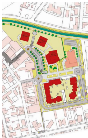
IL PRECEDENTE PROGETTO, CON I PALAZZI DI 13 PIANI (IN ROSSO IN ALTO) POSIZIONATI DIVERSAMENTE E LA NUOVA SCUOLA (IN ROSA)

Il costruttore, però, ristrutturerà completamente la scuola secondaria di primo grado De Filippo,