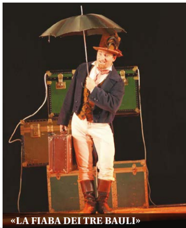
«LA FIABA DEI TRE BAULI»

trascinanti tra quelli pensati per bambini e famiglie. Diverte sia i più piccoli che i ragazzi e i genitori con trovate sorprendenti. Tecnica: teatro d'attore e coinvolgimento attivo del pubblico. Adatto dai 3 anni. Durata 60 minuti. Ingresso adulti 9 euro, bambini e ragazzi 6 euro.