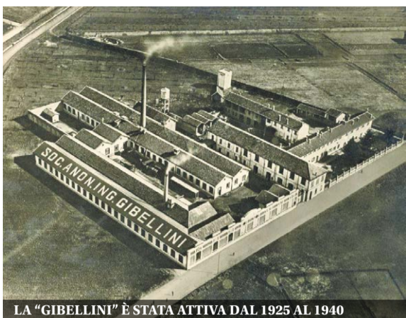
LA "GIBELLINI" È STATA ATTIVA DAL 1925 AL 1940

Lo storico Enrico Sangalli in viaggio nel passato industriale della frazione