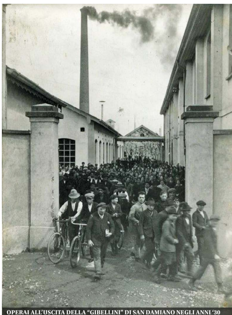
OPERAI ALL'USCITA DELLA "GIBELLINI" DI SAN DAMIANO NEGLI ANNI '30

«Un primo importante ampliamento territoriale fu subito inoltrato al Comune di Brugherio dalla nuova proprietà subentrata, la Società Anonima Fabbrica Materiali Isolanti Ingegnere Gibellini , la quale allegava alla richiesta un disegno che in mappa riportava il preesistente stabilimento e le nuove aggiunte (due campate aggiuntive), come ricorderà il figlio Folco Gibellini . L'attività produttiva funzionerà a pieno regime nel 1925». A questa prima richiesta,