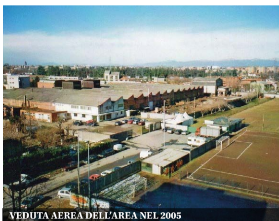
VEDUTA AEREA DELL'AREA NEL 2005