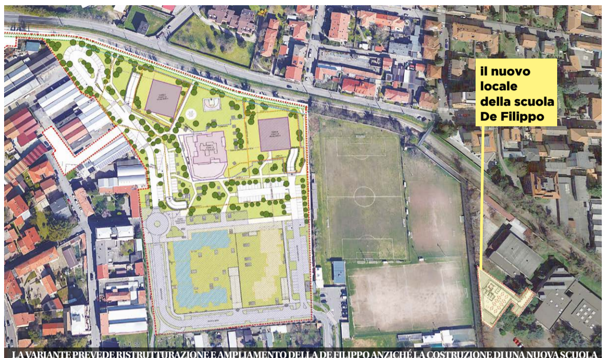
LA VARIANTE PREVEDE RISTRUTTURAZIONE E AMPLIAMENTO DELLA DE FILIPPO ANZICHÉ LA COSTRUZIONE DI UNA NUOVA SCUOLA

realizzando anche un nuovo ambiente polifunzionale che potrà essere utilizzato come mensa, ma anche per diverse attività a servizio della scuola o del quartiere.