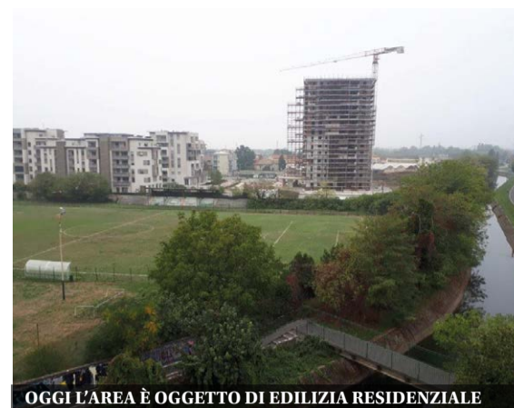
OGGI L'AREA È OGGETTO DI EDILIZIA RESIDENZIALE