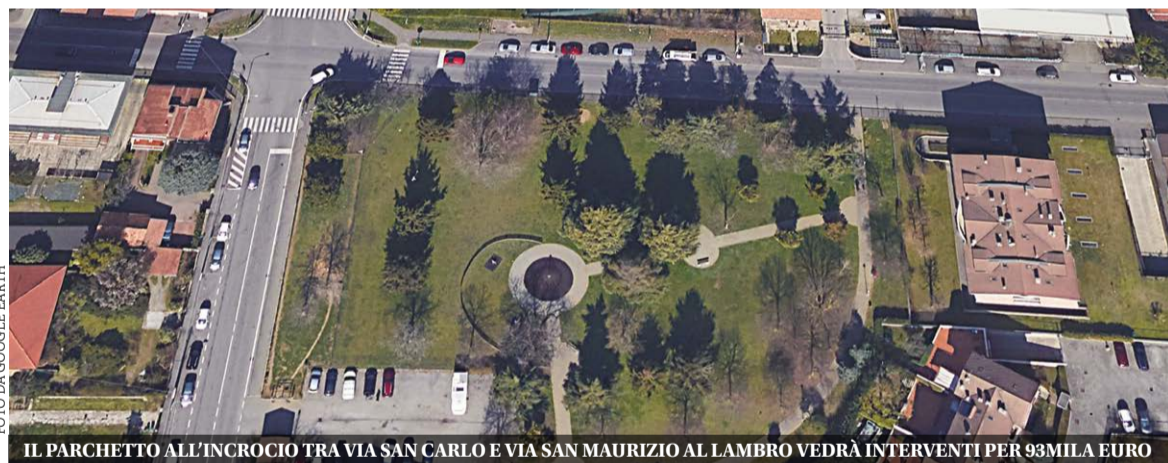
IL PARCHETTO ALL'INCROCIO TRA VIA SAN CARLO E VIA SAN MAURIZIO AL LAMBRO VEDRÀ INTERVENTI PER 93MILA EURO