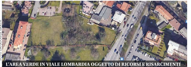
L'AREA VERDE IN VIALE LOMBARDBIA OGGETTO DI RICORSI E RISARCIMENTI

2022, ha imposto al Comune il pagamento di 200mila euro, che il Comune ha pagato a maggio a Talsedil. Si trattava di un primo pagamento che, in linea teorica, non escludeva ulteriori pretese economiche da parte di Talsedil. Anche sulla base di quella prima sentenza a favore del privato da oltre mezzo milione di euro. L'accordo trovato da Comune e Talsedil, sottoscritto in settimana, pone fine alla