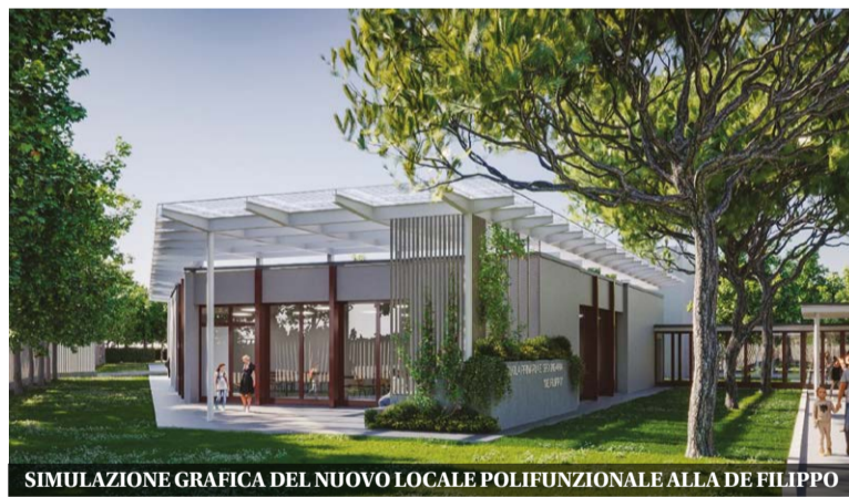
SIMULAZIONE GRAFICA DEL NUOVO LOCALE POLIFUNZIONALE ALLA DE FILIPPO