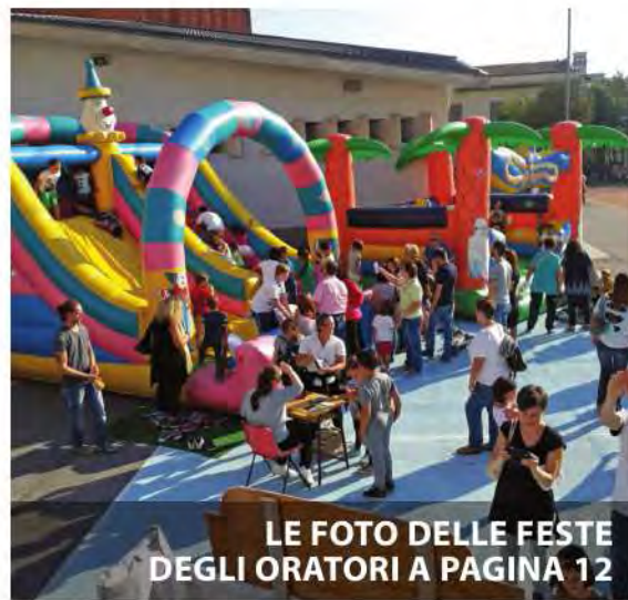
LE FOTO DELLE FESTE DEGLI ORATORI A PAGINA 12