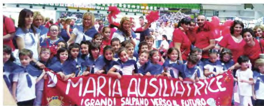
I "grandi" della scuola dell'infanzia Maria Ausiliatrice

Il 21 maggio, si sono ritrovati tutti al PalaIper di Monza (nella foto, i bimbi dell'asilo Maria Ausiliatrice che rappresentavano la città insieme alla scuola San Luigi di Sant'Albino) e, per l'occasione, hanno inviato una lettera al Pontefice. Il quale l'ha "letta con particolare attenzione" e ha risposto, per mano di monsignor Paolo Borgia,