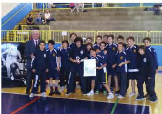
I ragazzi Under 13 del Cgb