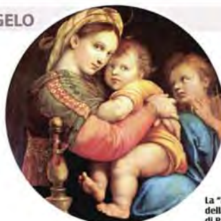
La "Madonna della seggiola" di Raffaello

■ Maggio è il mese tradizionalmente dedicato alla Madonna e anche nella Comunità Pastorale sono previsti alcuni appuntamenti straordinari per celebrarlo al meglio. Oltre ai rosari animati dai residenti dei diversi quartieri, sono tre gli eventi che coinvolgeranno tutte le parrocchie. Domenica 1 maggio alle 21 si festeggerà l'apertura del mese mariano presso la parrocchia di San Carlo con la recita del rosario e la processione con le fiaccole per le vie del quartiere. La chiusura sarà invece martedì 31 maggio alle 21 a San Paolo con la recita del rosario. È stato poi organizzato un pellegrinaggio a Venegono Inferiore (VA). La partenza è prevista per le 18, il costo è di 9 euro e le iscrizioni si raccolgono entro il 17 maggio. Per informazioni e iscrizioni è possibile rivolgersi alle segreterie parrocchiali negli orari di apertura ( www.epifaniadelsignore.it ).