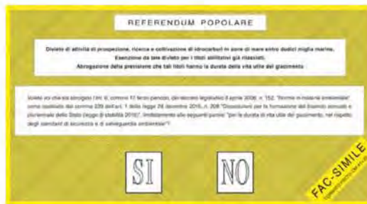
Fac simile della scheda referendaria

■ Domenica 17 aprile si terranno, presso le sedi delle sezioni elettorali, le votazioni per il referendum abrogativo. Sarà possibile votare dalle ore 7 alle ore 23, esibendo la propria tessera elettorale e un documento d'identità. I cittadini sono chiamati a rispondere "sì" o "no" alla proposizione: "Divieto di attività di prospezione, ricerca e coltivazione di idrocarburi in zone di mare entro dodici miglia marine. Esenzione da tale divieto per i titoli abilitativi già rilasciati. Abrogazione della previsione che tali titoli hanno la durata della vita utile del giacimento". Votando "sì", si sceglie di abro-