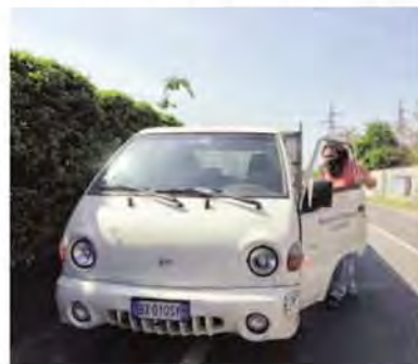
Distribuzione dei 112mila euro raccolti nel 2015 da Brugherio Oltremare

L'assemblea annuale di Brugherio Oltremare ha distribuito 112mila euro ai sacerdoti brugheresi nel mondo