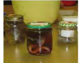
A. Pallavicini e I fossili - dott.ssa D. Grilli.