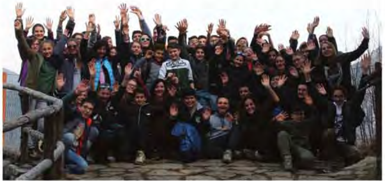
Foto di gruppo per i preadolescenti di prima e seconda media di san Bartolomeo in uscita a Castione della Presolana. Insieme agli educatori hanno riflettuto sulla storia di Abramo, tra giochi, passeggiate, canti e incontri.