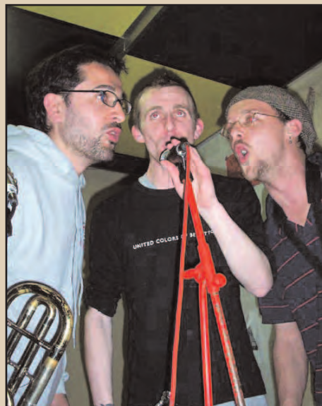
JAMAICA RED STRIPE