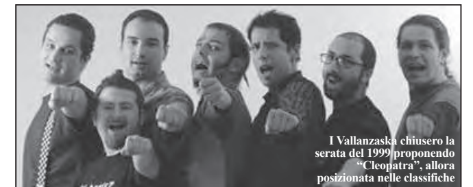
I Vallanzaska chiusero la serata del 1999 proponendo "Cleopatra", allora posizionata nelle classifiche

Nonostante tu ritenga impossibile nominare un'edizione in particolare, puoi fare un'eccezione e svelarci l'anno in cui Broostock ha ottenuto un successo particolare o si è rivelato importante per voi organizzatori? Secondo la mia opinione, l'edizione del 1999 fu la migliore.